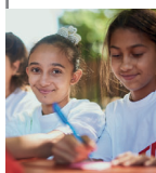
Cimlapunkon: „Tanítsunk Magyarorszáért!” – kortárs mentorálási program a köznevelésben (is)