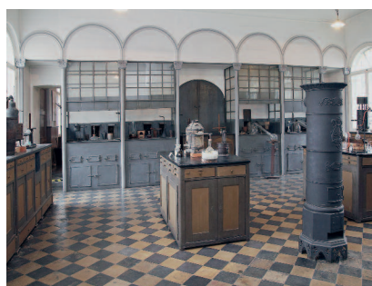
Az analitikai labor a giesseni múzeumban