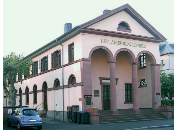
A giesseni Liebig Múzeum épülete

Nemcsak azt tanácsolta a parasztnak, hogy az emberi és állati salakanyagot juttassák vissza a talajba trágyaként, hanem káliumot és foszfort tartalmazó mesterséges trágyákat is készített. Kezdetben igen zavarba ejtő eredményeket kapott, mert oldatlan összetevőket használt fel, és egyszer egy katasztrofális műtrágyát szabadalmaztatott, amelyet árultak is Németországban és Nagy-Britanniában. De amikor az összetevőket vízben oldhatóvá tette, nagyszerű eredményeket ért el, és a német műtrágyaipar hatalmas fejlődésnek indult. „Ha meg tudom érteni a paraszttal a növények táplálásának, a talaj termékenységének alapelveit, a talaj kimerülésének okait – írta Liebig –, életem egyik célját teljesítettem.”