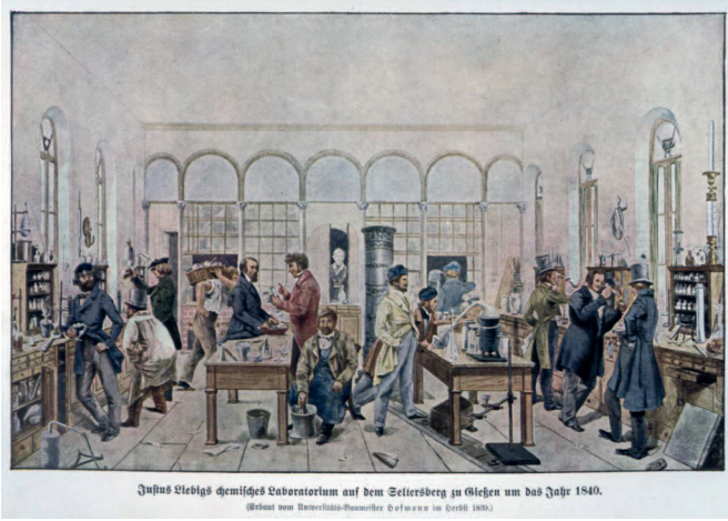
Justus Liebig's chemisches Laboratorium auf dem Seifersberg zu Siegen um das Jahr 1840. (Abmalung von Demetrius-Romanoff's Zeichnung im Jahre 1881.)