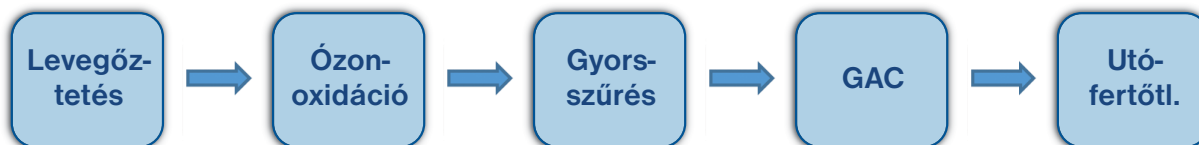
3. ábra. A parti szűrés technológiai sora (nagy vas- és mangánkoncentrációk esetén)

szennyezőanyag-koncentráció és a megnövelt ózondózis miatt az aktív-szén-adszorberek is hamarabb merülnek ki, így a tölteteket gyakrabban kell regenerálni vagy cserélni. Végül az utófertőtlenítéskor is lehet avatkozni; a fertőtlenítőszer-koncentráció növelésével, illetve – amennyiben lehetőség van rá – többlépcsős fertőtlenítéssel (pl. kiegészítő ultraibolya fertőtlenítéssel) tovább csökkenthető a mikroorganizmusok mennyisége.