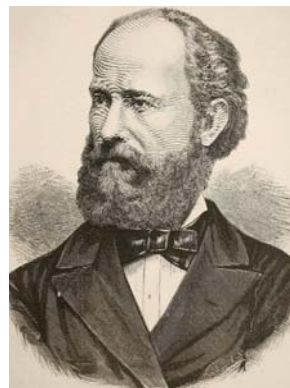
Than Károly (1834–1908)

Alapos előtanulmányai után 1860-ban a pesti egyetemen a kémiai tanszék helyettes tanára, 1862. július 18-án pedig a tanszék professzora lett. Ekkor lényeges követelmény volt a kiváló magyar nyelvtudás, mert addig a pesti egyetemen is németül folyt az oktatás. Than ettől kezdve a közoktatás, a közművelődés és a tudományos munkásság hazai felvirágoztatásának érdekében tevékenykedett. Tervei szerint új Kémiai Intézet épült, amely a Trefortkerten 1872-re készült el. Ez az épület ma is áll a Múzeum krt. 4/b alatt, a felújított épületben bölcsészkarai szakok működnek.