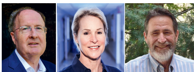
Sir Gregory P. Winter, Frances H. Arnold, George P. Smith

A 2018. évi kémiai Nobel-díjat felerészben Frances H. Arnold kapta, a másik felén, egyenlő arányban, George P. Smith és Sir Gregory P. Winter osztozott. Az idei kémiai Nobel-díjak az evolúció erejének kémiai hasznosítását ismerték el. A három díjazott kutató munkája alapot teremtett az evolúciós folyamatok mechanizmusainak kiaknázásához és az emberiség szolgálatába állításához. Az irányított evolúció és a fágbemutatás olyan technikai lehetőségeket jelentenek, melyek révén enzimfehérjéket és antitesteket lehet egyrészt ipari célú alkalmazások, másrészt számos autoimmun- és egyes áttétes tumoros betegségek elleni küzdelem számára előállítani és optimalizálni.